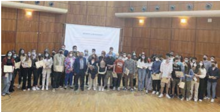
Βραβεύτηκαν οι επιτυχόντες μαθητές στην Τριτοβάθμια Εκπαίδευση κατά τα σχολικά έτη 2020 και 2021