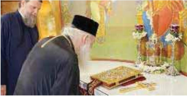
ΠΑΡΟΥΣΙΑ ΤΟΥ ΑΡΧΙΕΠΙΣΚΟΠΟΥ ΙΕΡΩΝΥΜΟΥ