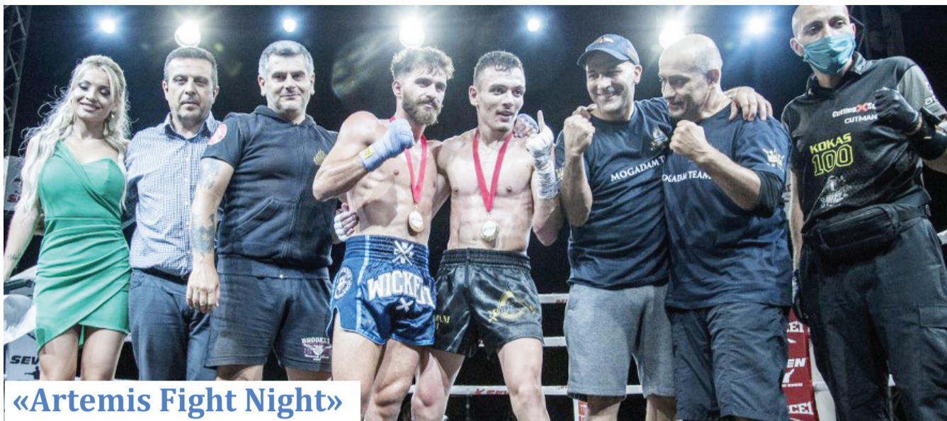
«Artemis Fight Night»