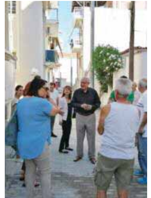
ΣΤΟΧΟΣ Η ΒΕΛΤΙΣΤΗ ΠΑΡΟΧΗ ΥΠΗΡΕΣΙΩΝ ΣΤΟΥΣ ΠΟΛΙΤΕΣ

Το Δημοτικό Συμβούλιο του Δήμου Παπάγου - Χολαργού καταδικάζει με τον πλέον κατηγορηματικό τρόπο αυτή την απόφαση και καλεί τον Πρόεδρο Ερντογάν να την αναθεωρήσει και να διατηρήσει ο ναός, ο οποίος αποτελεί πανανθρώπινο μνημείο πολιτιστικής κληρονομιάς τον μουσειακό του χαρακτήρα».