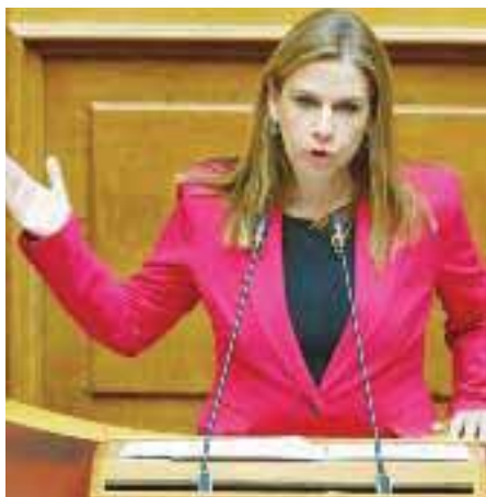
ΤΗΣ ΖΩΗΣ ΡΑΠΤΗ

ΒΟΥΛΕΥΤΗΣ Β1 ΒΟΡΕΙΟΥ ΤΟΜΕΑ ΑΘΗΝΩΝ ΚΑΙ ΑΝ. ΚΟΙΝΟΒΟΥΛΕΥΤΙΚΗ ΕΚΠΡΟΣΩΠΟΣ ΤΗΣ ΝΕΑΣ ΔΗΜΟΚΡΑΤΙΑΣ