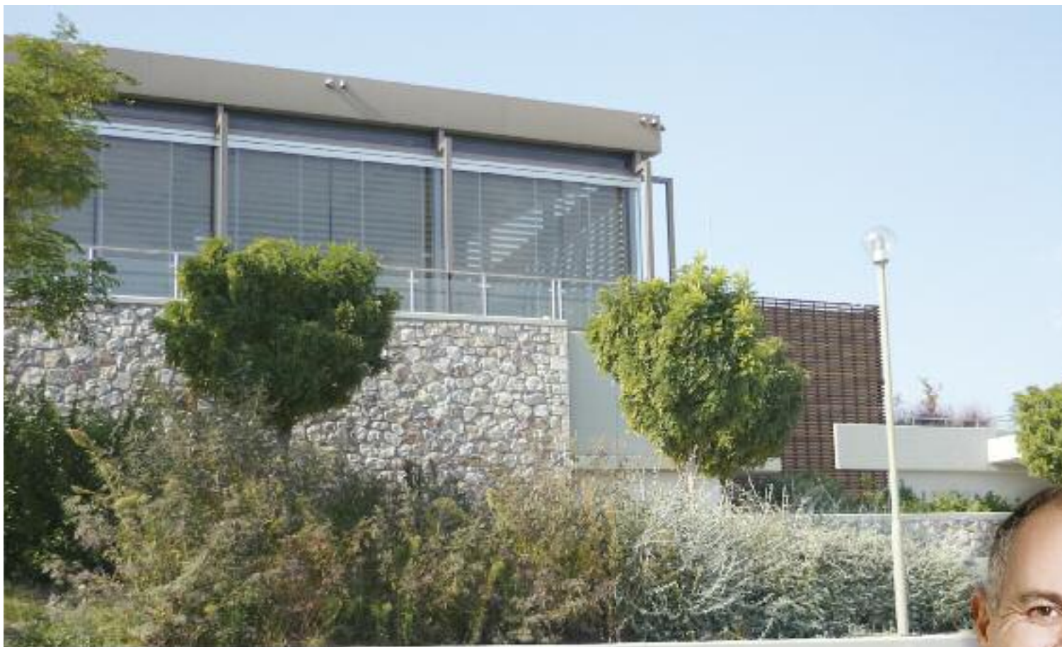
Το συνεδριακό κέντρο του δήμου Μεταμόρφωσης

παδόπουλος , λέγοντας: “Κύριε Τσίκνα αυτό ήταν και προσωπική και πολιτική απρέπεια. Ο πολιτικός χώρος που μας ανέδειξε και μας καταξίωσε χρήζει μίας άλλης συμπεριφοράς από μέρους σου. Λυπάμαι για την απρέπεια σου. Ήταν μία δημοκρατική διαδικασία του ΠΑΣΟΚ της εποχής εκείνης για την ανάδειξη του Μιλτιάδη Καρπέτα ως υποψήφιου δημάρχου Μεταμόρφωσης.