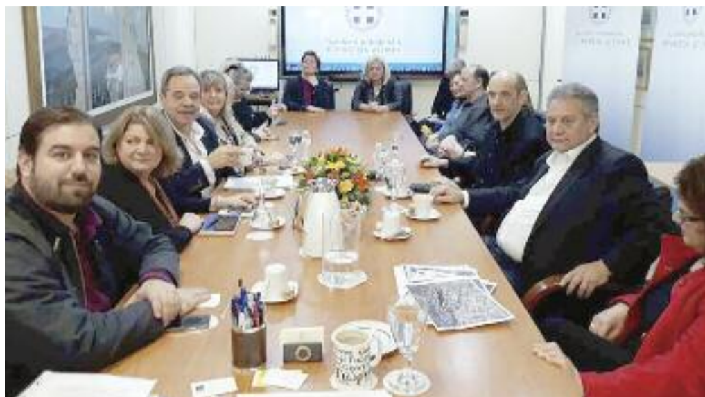
ΕΞΕΦΡΑΣΑΝ ΤΗΝ ΑΝΤΙΘΕΣΗ ΤΟΥΣ ΣΤΟΝ ΠΕΡΙΦΕΡΕΙΑΡΧΗ ΑΤΤΙΚΗΣ, Γ. ΠΑΤΟΥΛΗ