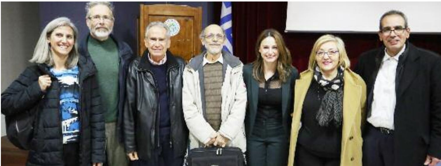
ΕΝΑΡΚΤΗΡΙΑ ΔΙΑΛΕΞΗ ΕΛΕΥΘΕΡΟΥ ΠΑΝΕΠΙΣΤΗΜΙΟΥ ΔΗΜΟΥ ΠΕΝΤΕΛΗΣ