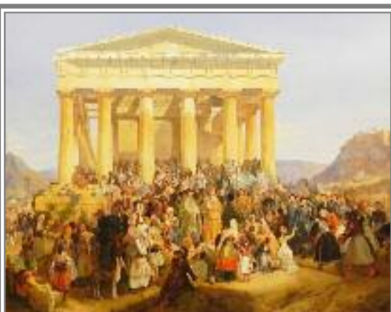
ΣΤΗ ΔΙΑΛΕΞΗ ΜΕ ΤΙΤΛΟ «185 ΧΡΟΝΙΑ ΑΘΗΝΑ ΠΡΩΤΕΥΟΥΣΑ»

Εντυπωσίασε το κοινό του Δήμου Παπάγου – Χολαργού η Ιστορικός Τέχνης και Συγγραφέας Ιστορικών και Λαογραφικών Μελετών Άρτεμις Σκουμπουρδή