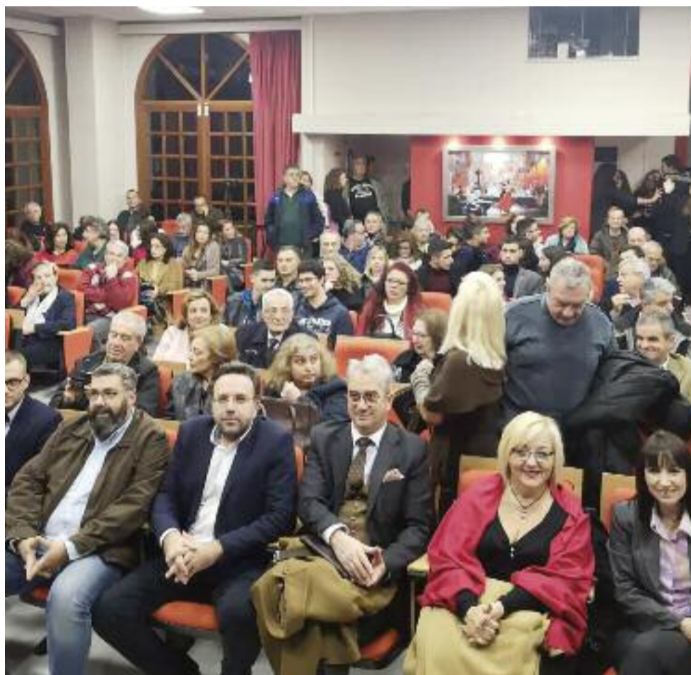
ΣΕ ΚΛΙΜΑ ΣΥΓΚΙΝΗΣΗΣ