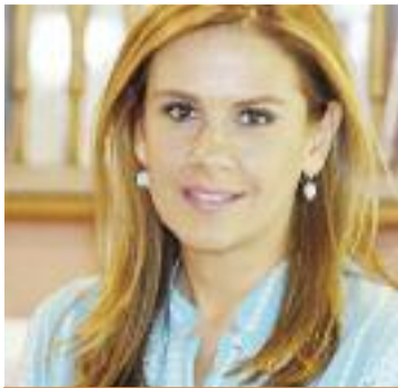
ΤΗΣ ΖΩΗΣ ΡΑΠΤΗ