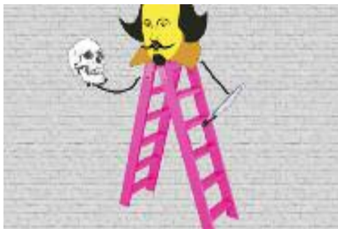
Η ΝΕΑ ΠΑΡΑΣΤΑΣΗ ΤΟΥ ΘΙΑΣΟΥ ΕΛΕΥΘΕΡΙΑΣ ΠΡΑΞΕΙΣ

«Ποιος Σκότωσε τον Ουίλιαμ» στο Πολιτιστικό Πολύκεντρο Ηρακλείου Αττικής