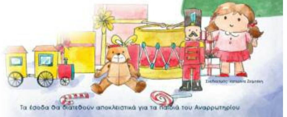
Τα έσοδα θα διατεθούν αποκλειστικά για τα παιδιά του Αναρρωτηρίου.