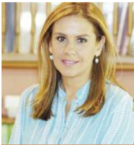
ΤΗΣ ΖΩΗΣ ΡΑΠΤΗ

Πρόσφατα ψηφίσαμε στη Βουλή τον νέο αναπτυξιακό νόμο, έχοντας ως βασική στόχευση τη διαμόρφωση φιλικού κλίματος για την προσέλκυση επενδύσεων στη χώρα μας και τη δημιουργία νέων και καλά αμειβόμενων θέσεων εργασίας, μια εξαγγελία που θέσαμε προεκλογικά, ως βασική για το Κυβερνητικό μας πρόγραμμα.