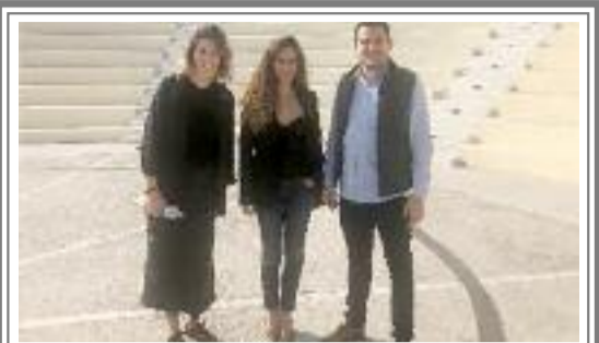
ΔΗΜΟΣ ΑΓ. ΑΝΑΡΓΥΡΩΝ - ΚΑΜΑΤΕΡΟΥ