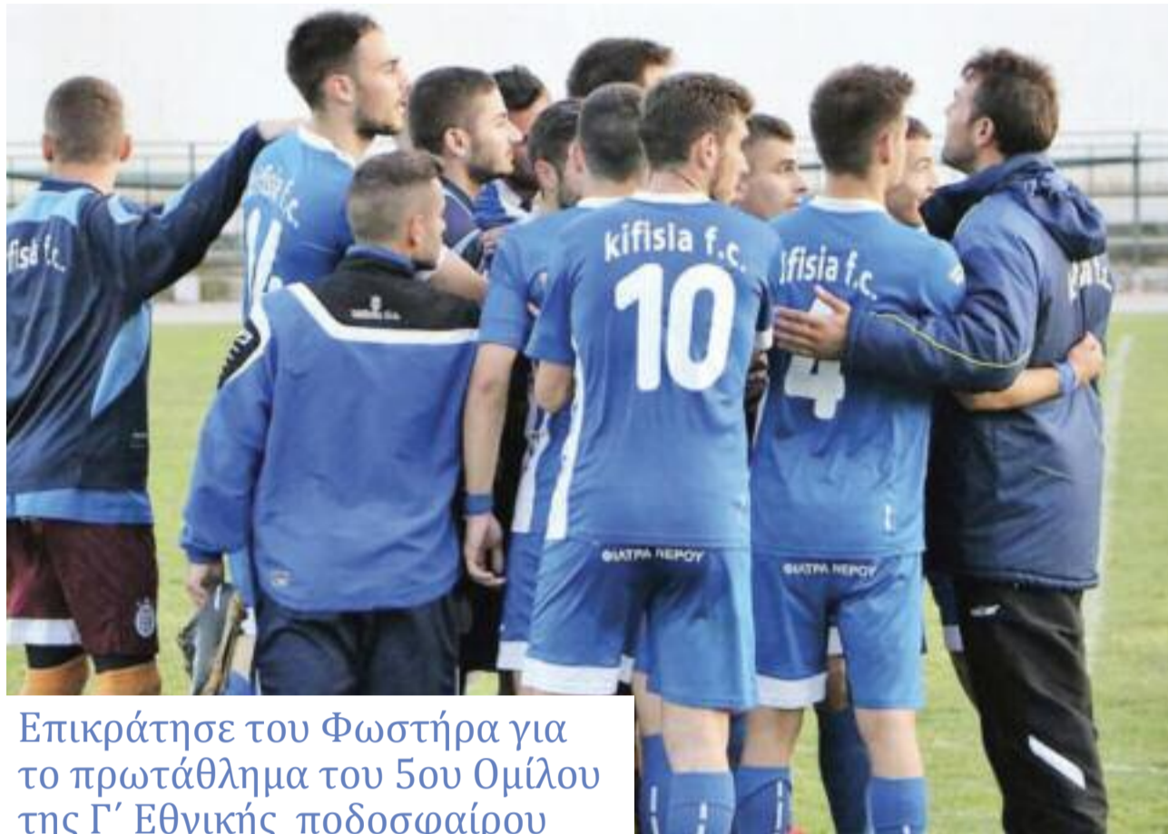
Επικράτησε του Φωστήρα για το πρωτάθλημα του 5ου Ομίλου της Γ' Εθνικής ποδοσφαίρου