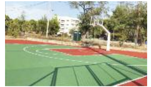
ΔΗΜΟΣ ΛΥΚΟΒΡΥΣΗΣ - ΠΕΥΚΗΣ