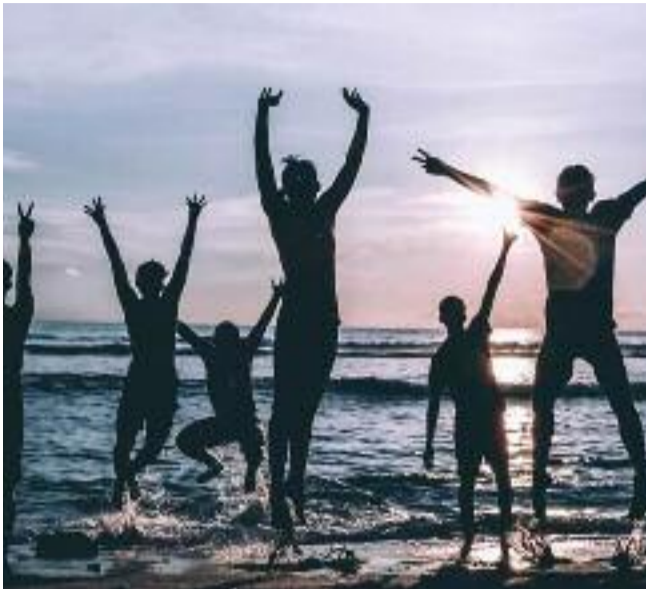
ΤΟ ΜΕΓΑΛΥΤΕΡΟ BEACH PARTY ΤΗΣ ΧΡΟΝΙΑΣ