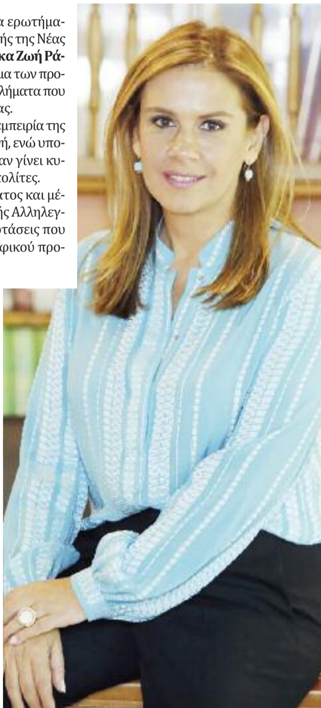
ΥΠΟΨΗΦΙΑ ΒΟΥΛΕΥΤΗΣ, ΤΗΣ ΝΕΑΣ ΔΗΜΟΚΡΑΤΙΑΣ, ΣΤΟ ΒΟΡΕΙΟ ΤΟΜΕΑ ΑΘΗΝΩΝ

Η τοπική αυτοδιοίκηση είναι μια μικρογραφία της κεντρικής πολιτικής σκηνής. Μαθαίνεις να εφαρμόζεις τις αρχές και τις γνώσεις σου στη διαχείριση των ζητημάτων που απασχολούν τους πολίτες. Ειδικά η εμπειρία της τοπικής αυτοδιοίκησης μπορεί να βοηθήσει έναν βουλευτή στην άσκηση των καθηκόντων του, αφού τον «προσ-