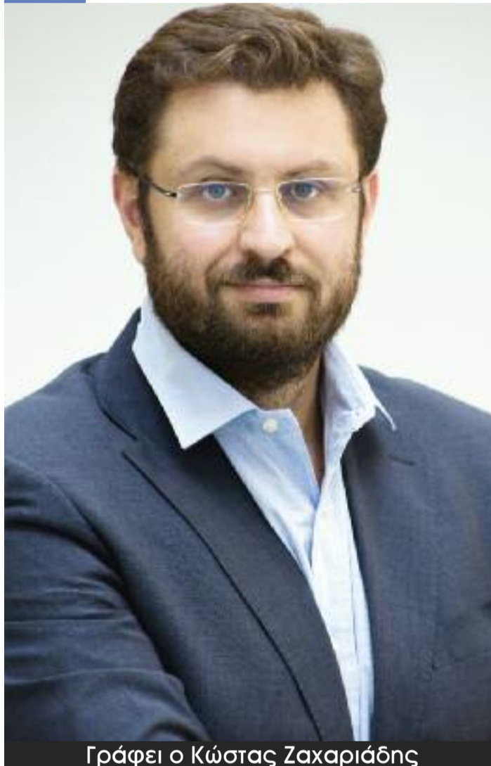
Γράφει ο Κώστας Ζαχαριάδης

Υποψήφιος στη Β1 εκλογική περιφέρεια Βορείου Τομέα Αθηνών