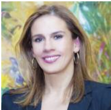
THE ZΩΗΣ ΡΑΦΤΗ