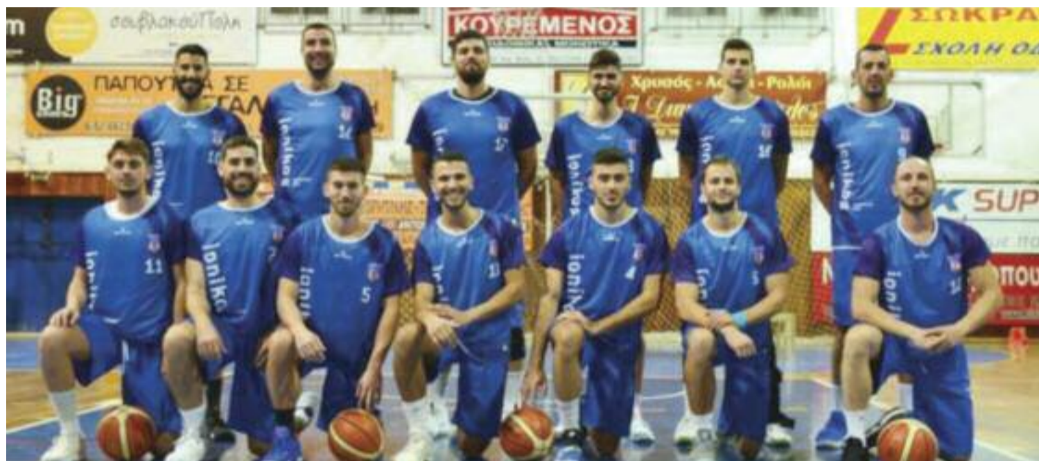
ΑΟ ΑΚΡΑΤΑΣ - ΙΩΝΙΚΟΣ ΑΣ ΝΕΑΣ ΦΙΛΑΔΕΛΦΕΙΑΣ 70-75

Ο Δήμαρχος Άρης Βασιλόπουλος συνεχάρη την ομάδα της ΦΕΑ για την επιτυχία της, παραδίδοντάς της ένα συμβολικό κύπελλο, ως έπαθλο. Τον αγώνα παρακολούθησαν μαζί με το Δήμαρχο, η πρόεδρος του Δημοτικού Συμβουλίου Ν. Φιλαδέλφειας – Ν. Χαλκηδόνας Γεωργία Χαραμαρά, αντιδήμαρχοι και δημοτικοί σύμβουλοι.