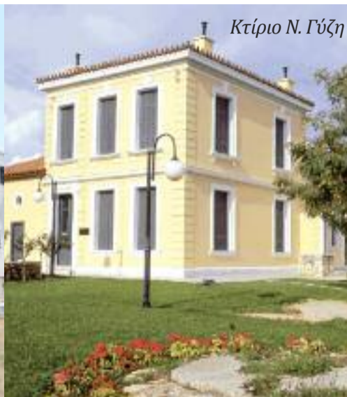
Κτίριο Ν. Γύζη