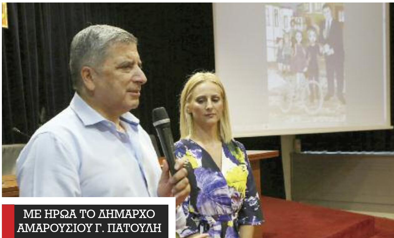
ΜΕ ΗΡΩΑ ΤΟ ΔΗΜΑΡΧΟ ΑΜΑΡΟΥΣΙΟΥ Γ. ΠΑΤΟΥΛΗ