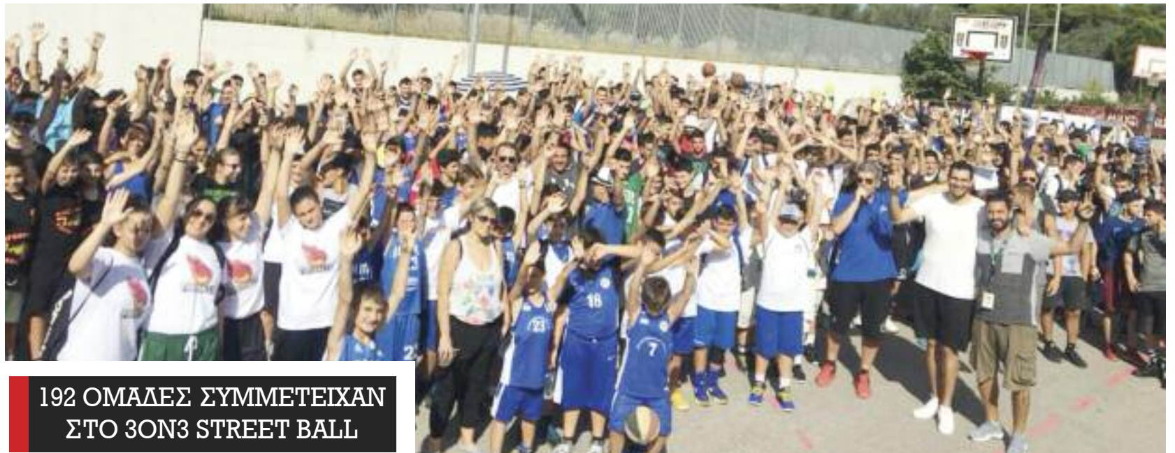
192 ΟΜΑΔΕΣ ΣΥΜΜΕΤΕΙΧΑΝ ΣΤΟ 3ΟΝ3 STREET BALL